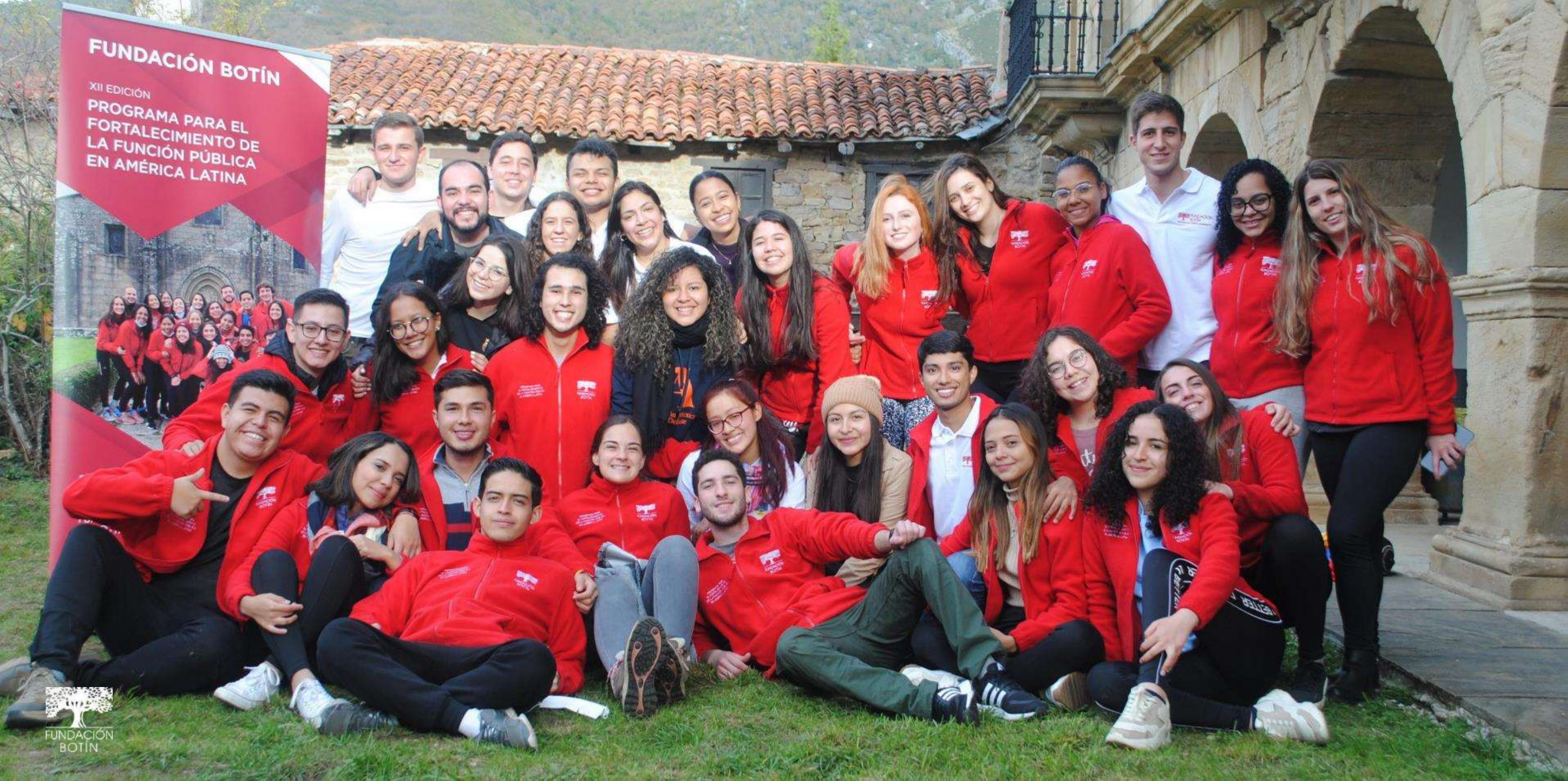
Bogotá – Madrid – Valle del Nansa – Santander – Ourense – Santiago de Compostela – Salamanca - Rio de Janeiro